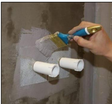
Beispiel zur Abdichtung der Armaturen